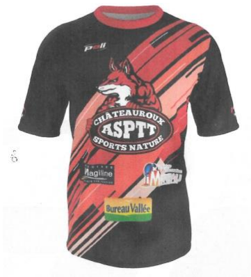
MAILLOT CLUB HOMME/ENFANT