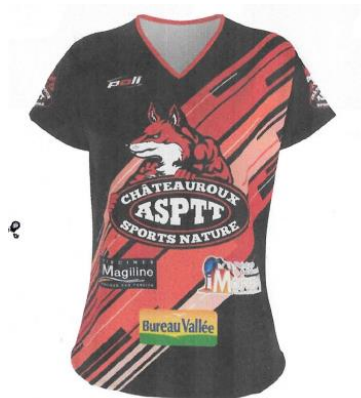
MAILLOT CLUB FEMME

Tous les ans, une tenue est offerte aux licenciés selon l'ancienneté dans le club. Maillot club noir ou paire de chaussettes.